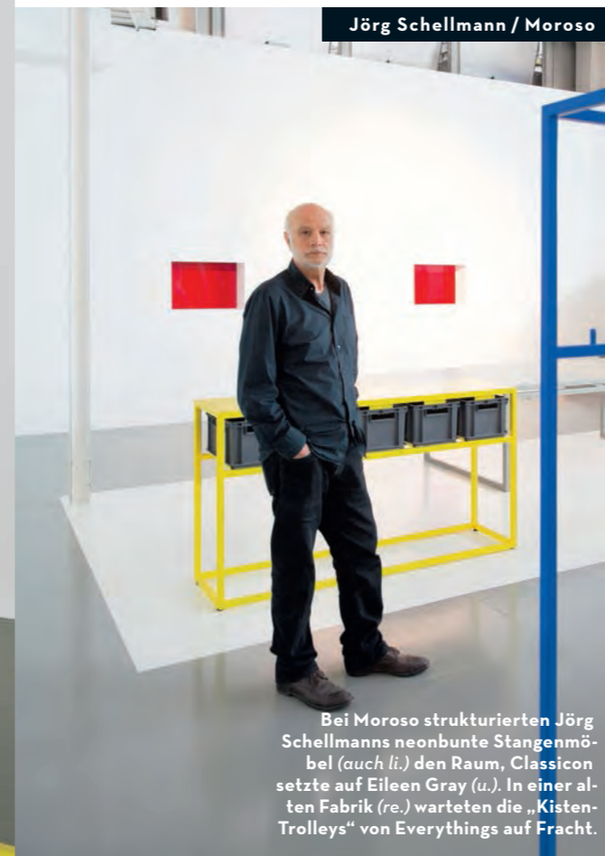
Jörg Schellmann / Moroso