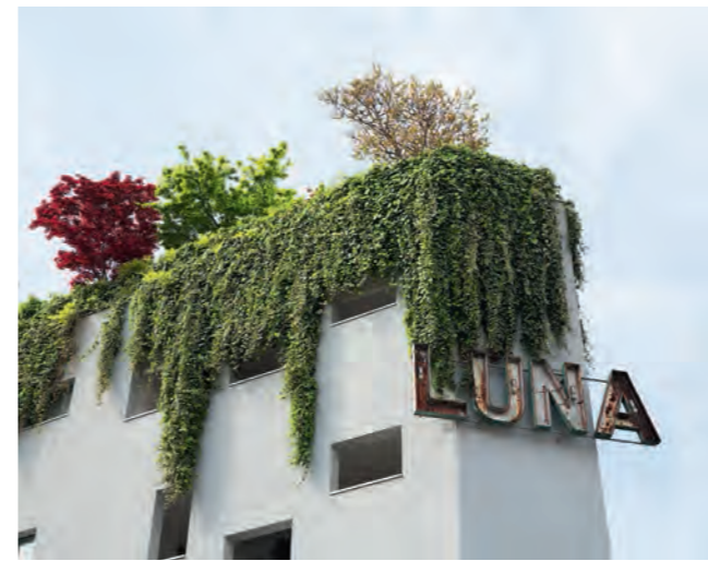
Quasi der Eiffelturm von Lambrate: Rund um die Galerie Luna (li.) reihen sich die kleinen Shops und Lagerhallen der Jungdesigner aneinander. Die Tischchen von Glas Italia hingegen entwarf ein Fixstern des Designs: Patricia Urquiola.